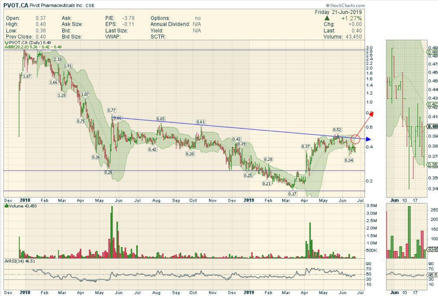
Chart PIVOT Pharmaceuticals Inc